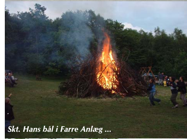
Skt. Hans bål i Farre Anlæg ...