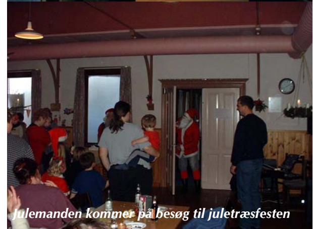
Julemanden kommer på besøg til juletræsfesten