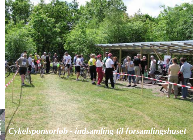
Cykelsponsorløb - indsamling til forsamlingshuset