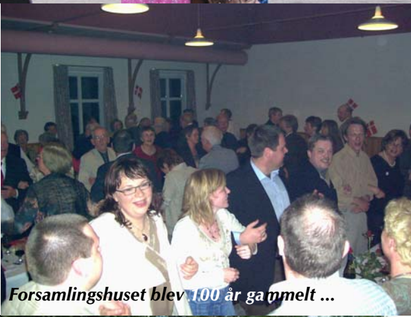
Forsamlingshuset blev 100 år gammelt ...