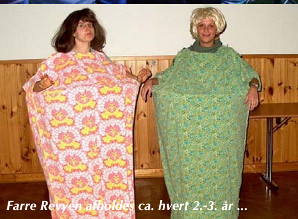
Farre Revyen afholdes ca. hvert 2.-3. år ...