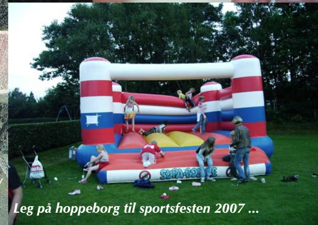
Leg på hoppeborg til sportsfesten 2007 ...