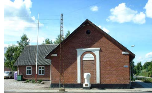
Farre Forsamlingshus - rammen om mange fester ...