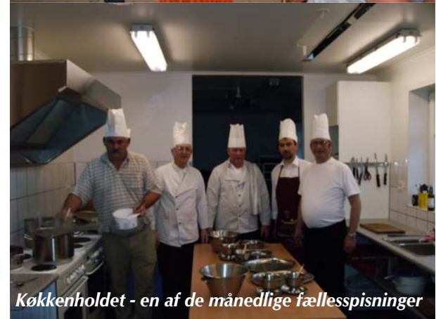
Køkkenholdet - en af de månedlige fællesspisninger