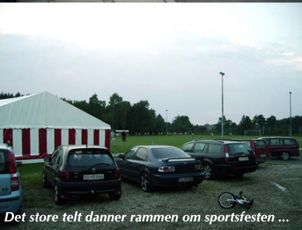
Det store telt danner rammen om sportsfesten ...