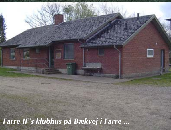
Farre IF's klubhus på Bækvej i Farre ...