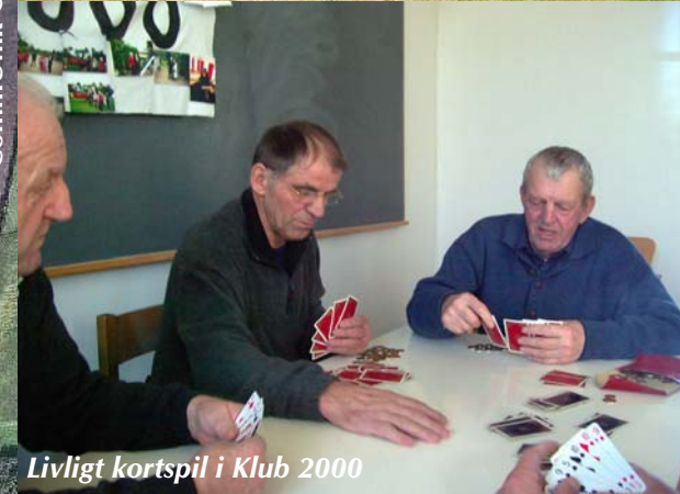
Livligt kortspil i Klub 2000