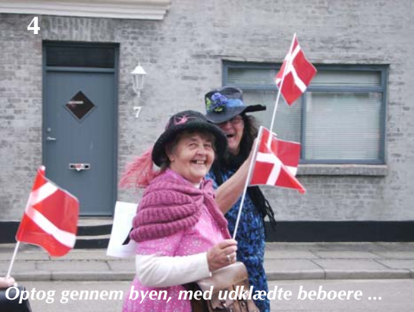
Optog gennem byen, med udklædte beboere ...