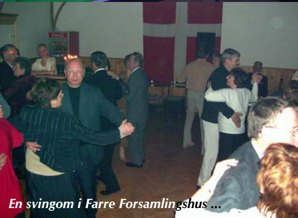
En svingom i Farre Forsamlingshus ...