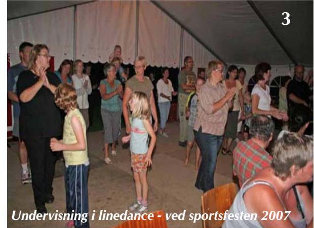
Undervisning i linedance - ved sportsfesten 2007