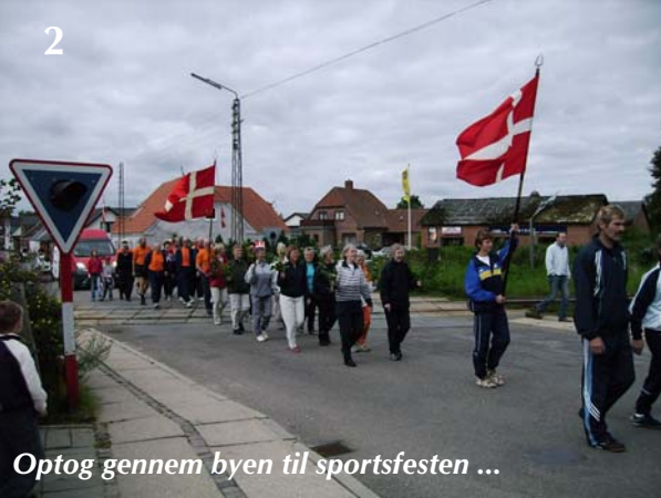
Optog gennem byen til sportsfesten ...