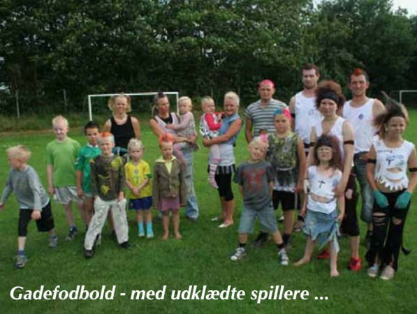
Gadefodbold - med udklædte spillere ...