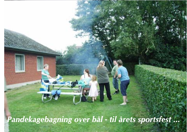
Pandekagebagning over bål - til årets sportsfest ...