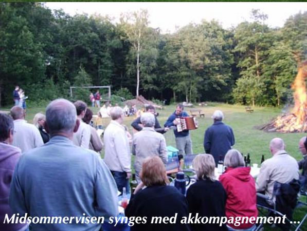
Midsommervisen synges med akkompagnement ...