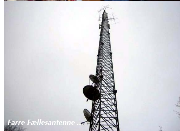
Farre Fællesantenne ...