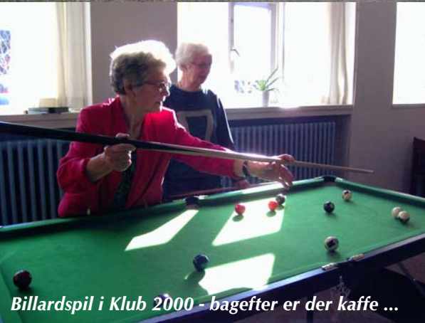
Billardspil i Klub 2000 - bagefter er der kaffe ...