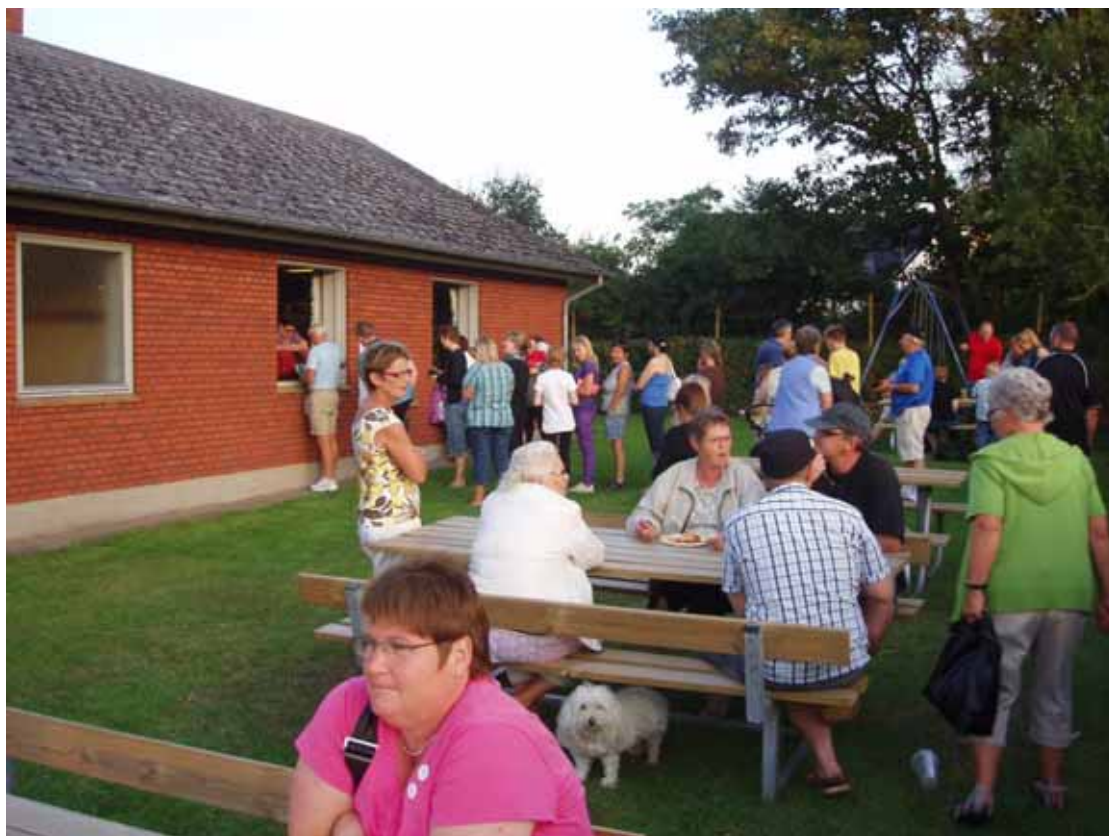
Der var rift om lodderne