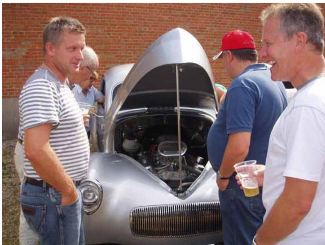
Vi havde "Amerikansk" besøg